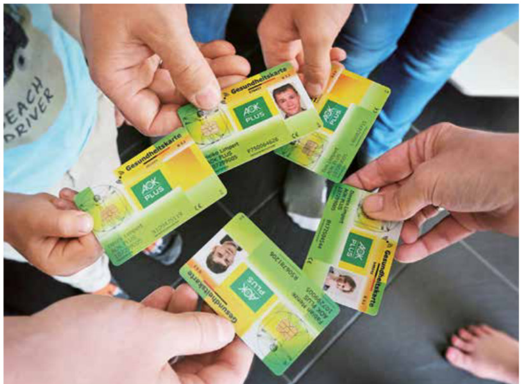
Familie versichert Kinder können nur in der Krankenkasse der leiblichen Eltern versichert werden

Ausweg Hier ist eine Risikolebensversicherung ratsam, die neue Partner »über Kreuz« abschließen: Sie versichern das Leben des Partners oder der Partnerin, jeder zahlt die eigenen Beträge. Stirbt ein Partner, erhält der andere die Versicherungsleistung aus seinem eigenen Vertrag; ohne Erbschaftsteuer und ohne Pflichtteil. ■