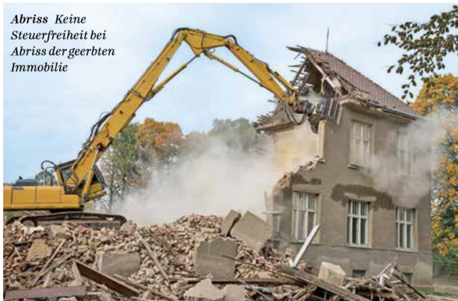
Abriss Keine Steuerfreiheit bei Abriss der geerbten Immobilie