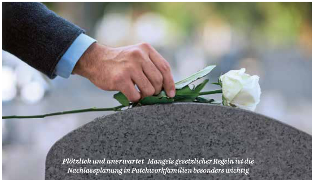
Plötzlich und unerwartet. Mangels gesetzlicher Regeln ist die Nachlassplanung in Patchworkfamilien besonders wichtig