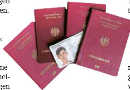
Passkontrolle Tragen Kind und Begleiter unterschiedliche Namen, wird es heikel

Vorsorge Um für medizinische Notfälle im Ausland gewappnet zu sein, ist es sinnvoll, dem Stiefelternteil auch eine Vorsorgevollmacht in Gesundheitsangelegenheiten für das Kind mitzugeben. ■